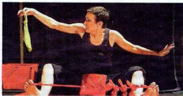
L'intrus provoque des rugissements de tigre.