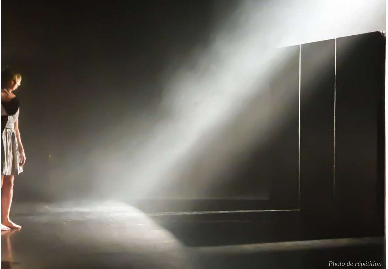
Photo de répétition

L'espace scénographique sera entièrement conçu à partir d'un principe de fusion totale entre le décor et la lumière, inspiré des dessins de Schuiten, des maîtres du clair-obscur et de l'oeuvre du plasticien Julio Le Parc.