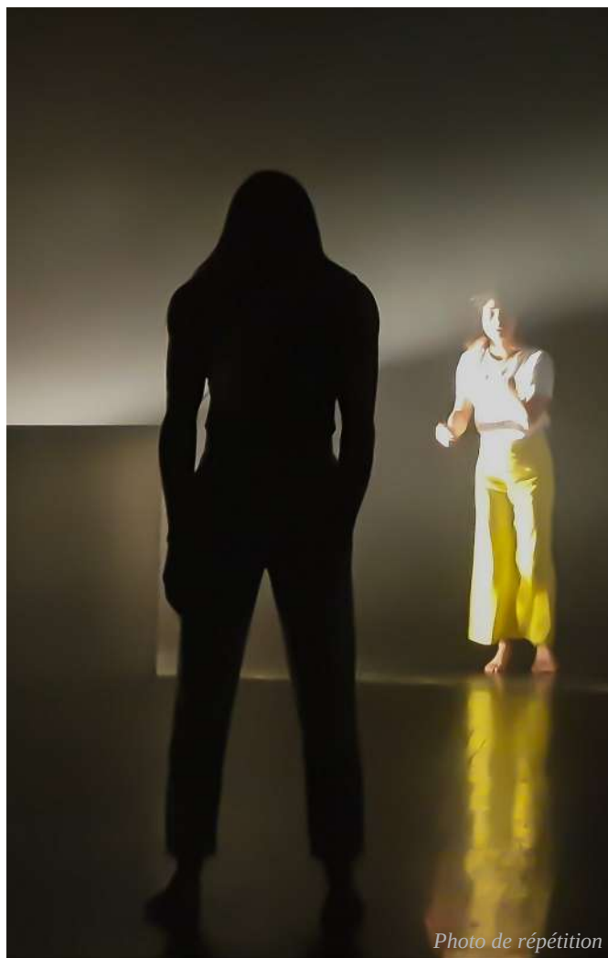
Photo de répétition

Pour inventer leurs personnalités complexes et dessiner les contours des relations, je me nourrirai particulièrement des ouvrages d' Edgar Morin ou Steven Pinker .