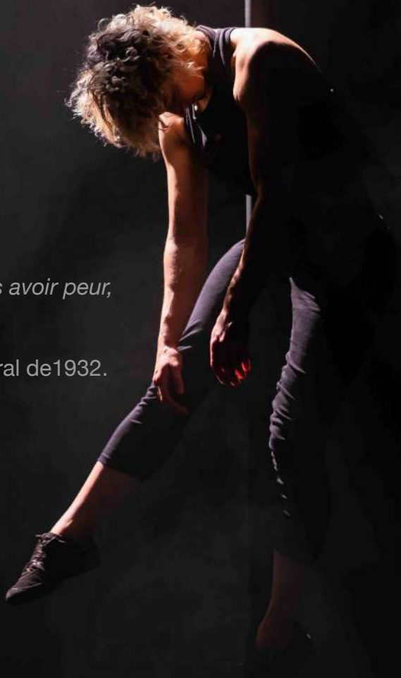
Photo de répétition

Franklin Roosevelt, discours inaugural de 1932.